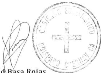
✠ Ramón Castro Castro