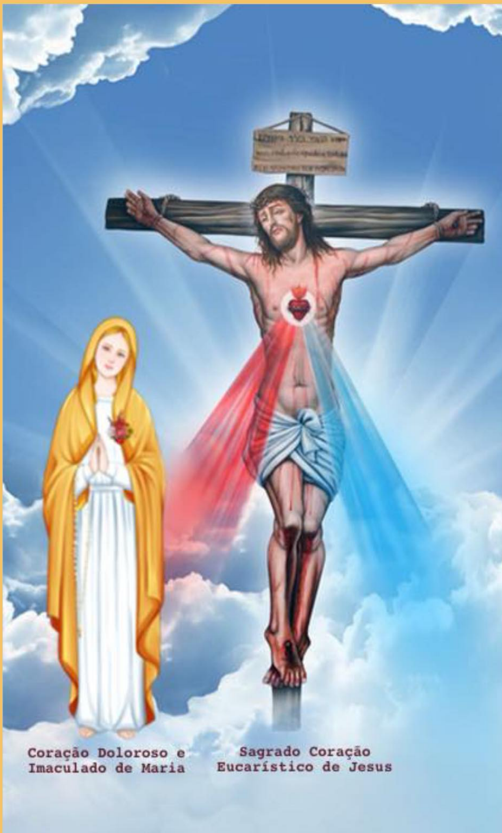
Coração Doloroso e Imaculado de Maria